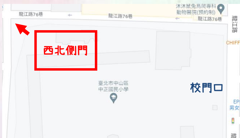
西北側門位置地圖