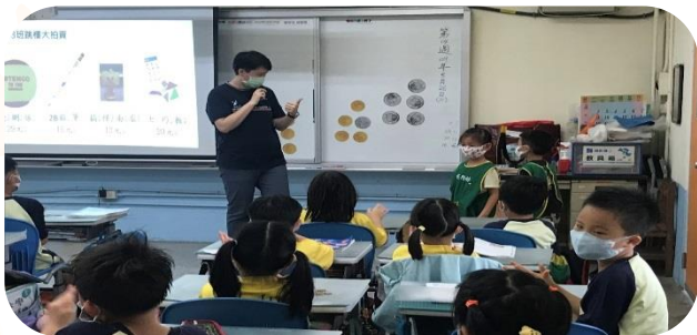
課堂中一起參與、互動