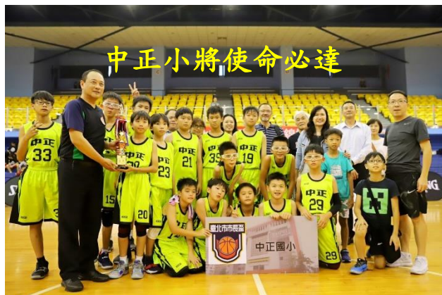
中正小將使命必達